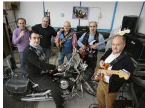
LOS ÁTOMOS (2012)