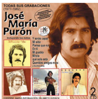
TODAS SUS GRABACIONES [1977-1982]