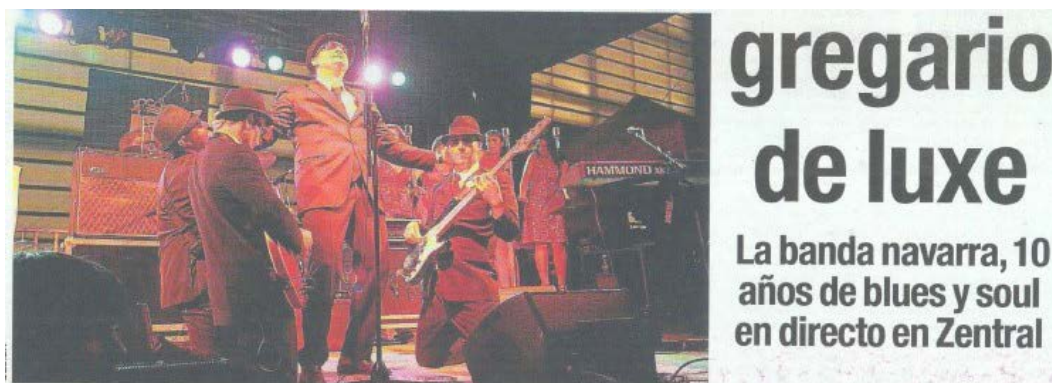
UN MOMENTO DE SU ACTUACIÓN EN EL ZENTRAL DEL MERCADO