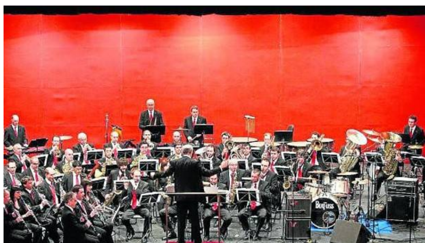
BANDA MUNICIPAL “LA PAMPLONESA” [En ese día]

3. La Pamplonesa y The Beat-Less. Conjuntamente -y cojonudamente- versionaron grandes temas, ya clásicos, como Penny Lane, Eleanor Rigby, etcétera.